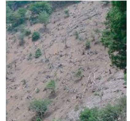
食害による植生が失われ土砂流出 (東京都農林総合センター)