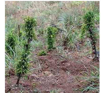
盆栽状になったスギ (森林研究・整備機構 森林総合研究所・九州)