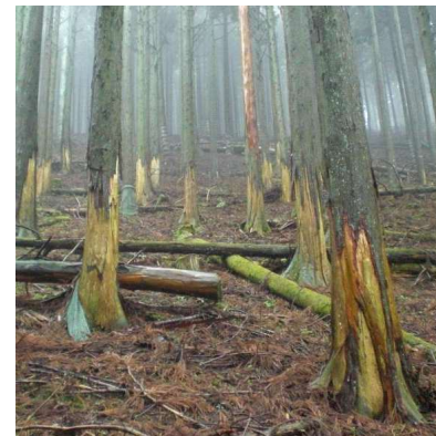
スギ人工林におけるシカの剥皮被害 (林野庁・滋賀県)